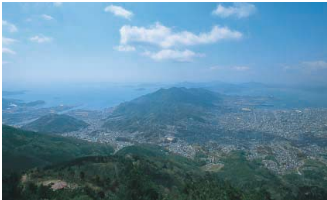
灰ヶ峰から望む呉市街地