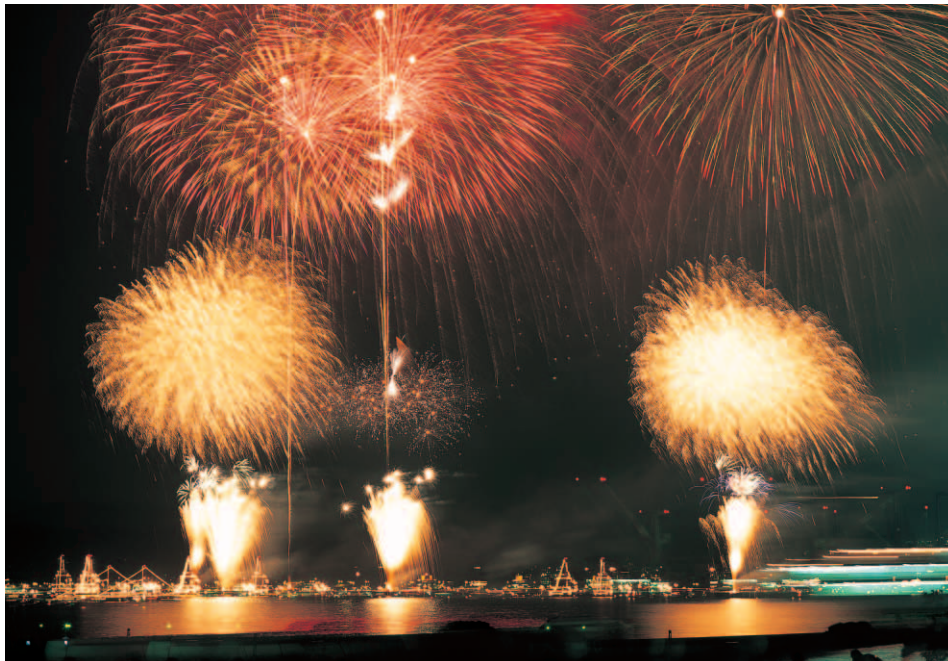
呉海上花火大会（呉港内海上）